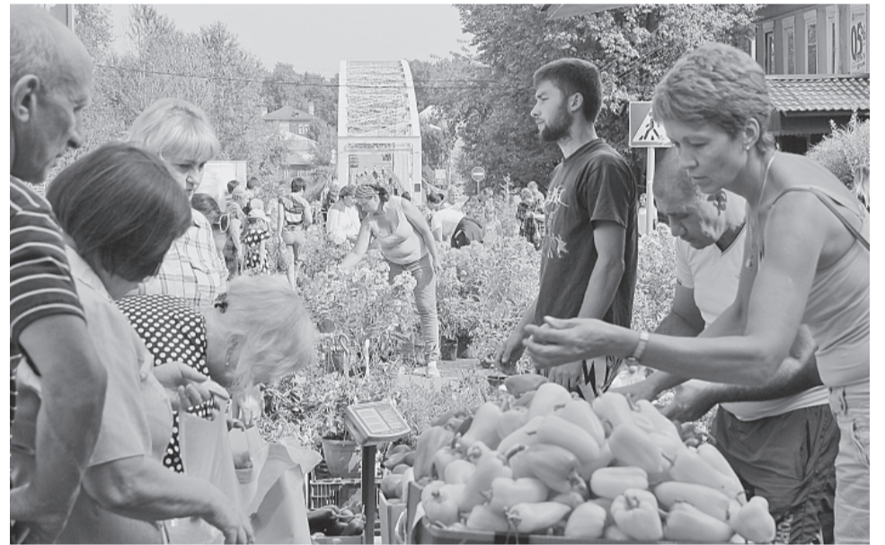
Фрукты и овощи из Адыгеи пользовались большим спросом!

...Рядом с «подворьями» приглашали на мастер-классы боровичские народные умельцы. «Мультиру-