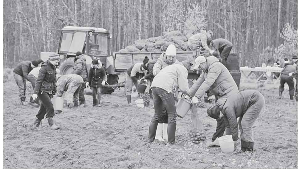
Вклад крестьянско-фермерских хозяйств в общий объем производимой в регионе сельхозпродукции составляет семь процентов

зяйств в общий объем производимой в регионе сельхозпродукции составляет 7 процентов. Это неплохой показатель: например, в соседних Псковской и Тверской областях КФХ не «взяли планку» в четыре процента. Но областные власти ставят перед собой амбициозную задачу: за три года вывести наших фермеров на 10-процентную «высоту». Чтобы помочь крестья-