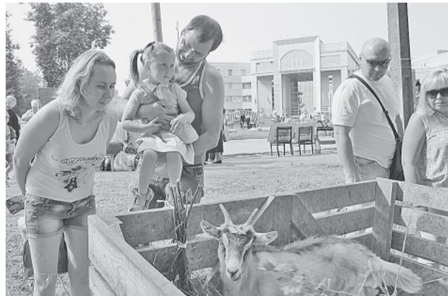
Внимание козочкам пришлось по нраву